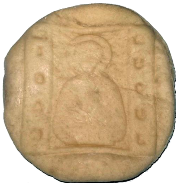
Prescura cu pecetea Sfântului Ioan

Prescura dulce nu e doar o simplă prezență în sărbătoarea hramului, ci o poveste care ne cuprinde pe toți! Truda mâinilor, măsura timpului, simbolistica grâului și dulceața mierii, jertfa slujirii și căldura rugăciunii săvârșite împreună fac din această ofrandă o mulțumire adusă Bunului Dumnezeu și Sfântului Ioan Rusul.